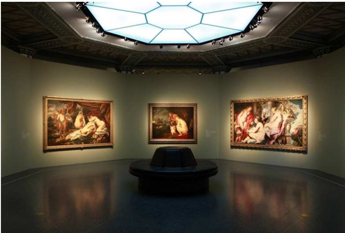
Ausstellungsraum im „Bucerius Kunst Forum“

Noch bis zum 19. September 2010 zeigt das Bucerius Kunst Forum am Hamburger Rathausplatz die Ausstellung „Rubens, van Dyck, Jordaens. Barock aus Antwerpen“. Die fünfzig Gemälde, Zeichnungen und Druckgraphiken, die dem Publikum in fünf geschickt ausgeleuchteten Sälen präsentiert werden, stammen aus dem Königlichen Museum für Schöne Künste in Antwerpen (KMSKA). Sie zeugen von der glanzvollen Entfaltung des flämischen Barocks in Antwerpen, das sich im 17. Jahrhundert zu