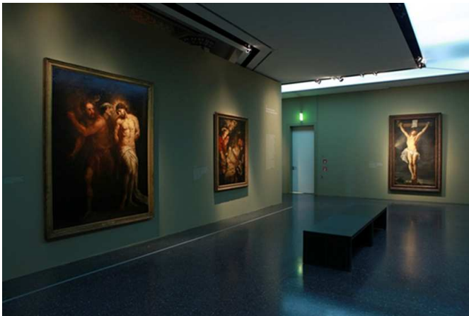
Ausstellungsraum im „Bucerius Kunst Forum“

Werkstatt pathosgeladene und figurenreiche Kompositionen entstanden sind.